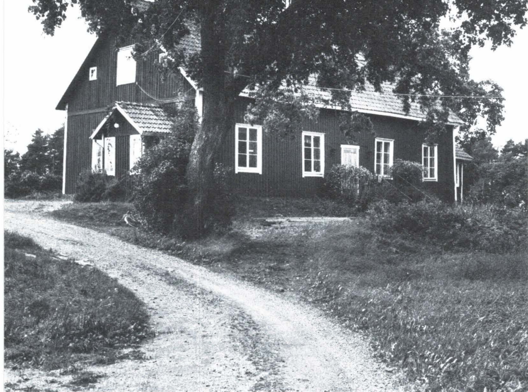
Bild 1. Huvudbyggnaden på gården Råby 1:1 i Vaksala socken uppförd på 1820-talet av Carl Petter Thunberg. Från början var lerväggarna putsade utvändigt. Den rödfärgade träpanelen uppsattes omkr. 1900.

byggande. Även länets hushållningssällskap propagerade ivrigt för detta byggnadssätt. Detta blev billigare än att bygga i sten men gav lika brandsäkra byggnader som stenhus.