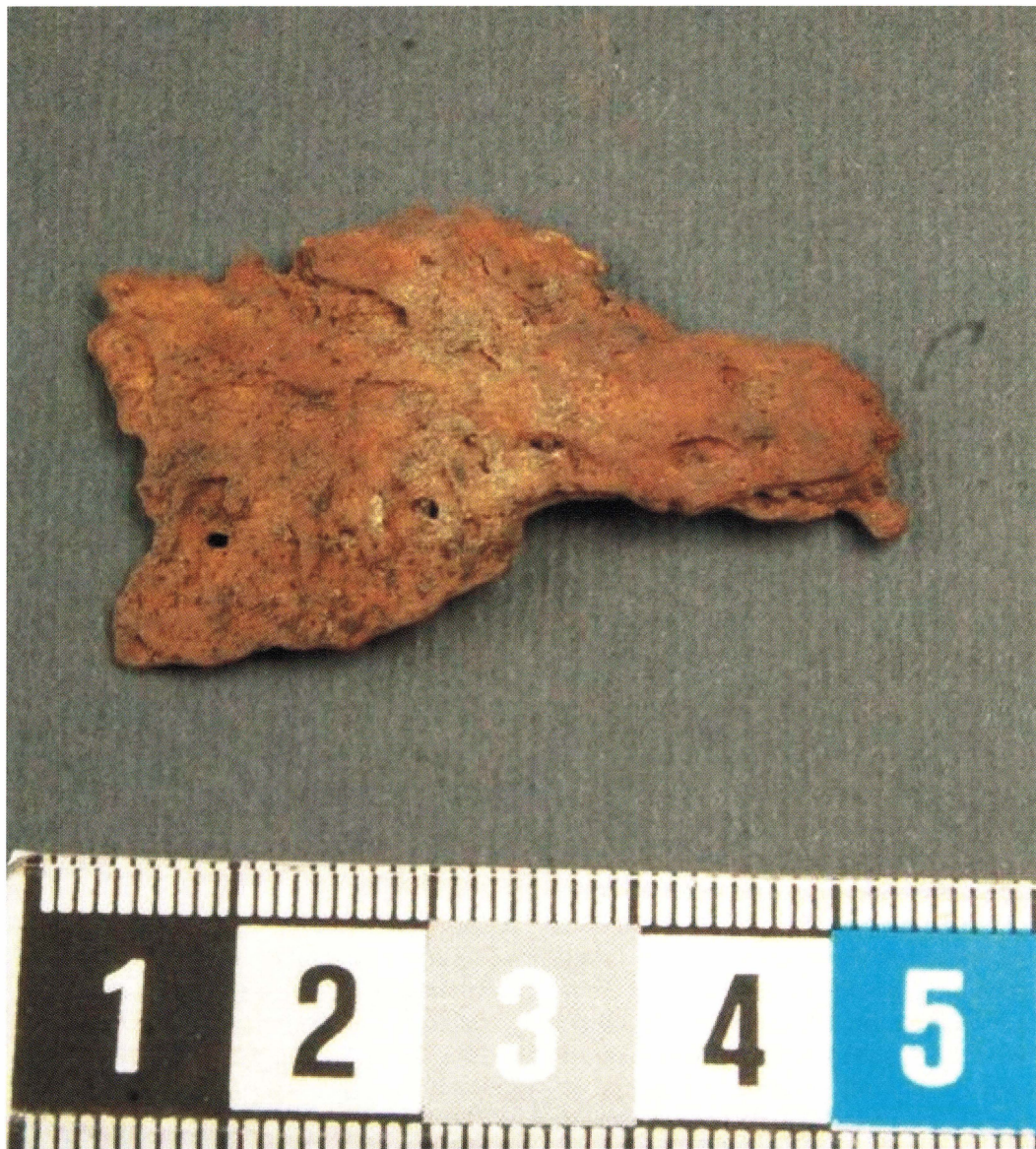
Figur 2. Pleurapansar från skelett 1.