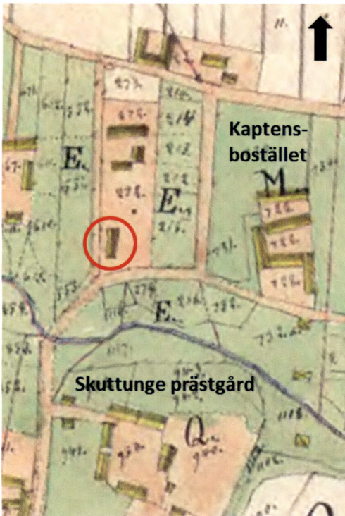
Fig. 5. Utsnitt ur 1833 års laga skifteskarta över Skuttungeby. Den aktuella byggnaden markerad med röd cirkel. Öster om vägen ligger kaptensbostället och söder om än återfinns vi prästgården.