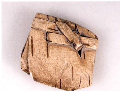
Fig. 13. Trollknyte påträffat under en tröskel i en byggnad strax utanför Skuttungeby. Upplandsmuseet (UM 10285).

Låt oss inleda genomgången av föremålen med hästskorna. Många har säkert sett sådana uppspikade över dörren för att skänka huset lycka. Detta förfarande har en koppling till äldre tiders föreställningar om vikten av att skydda huset och dess inneväsnare mot övernaturliga makter och ondskefulla väsen. Till att börja med kan konstateras att själva materialet, järn, och även dess mer förädlade form, stål, tillskriverits skyddsmagiska egenskaper. 30 Det skyddade både människor och djur. Särskilt bra ansågs eggjärn, det vill säga redskap och verktyg med egg, vara. Klyvkilen i fyndet kan räknas som ett sådant. Därför kunde till exempel en sax eller en kniv läggas i barnets vaggga eller under tröskeln till såväl bostadshus som fähus. Från Skuttunge finns exempel på ett så kallat trollknyte som hittades då en äldre stuga revs strax utanför själva byn. Det omkring 5 centimeter långa näverpaketet hittades under tröskeln till ytterdörren (fig. 13). Dess exakta innehåll är okänt då det aldrig öppnats, men ett metalliskt skramlande ljud vittnar om att det finns något av järn eller stål inuti. Föremålet överlämnades 1934 av dåvarande skuttungebagaren Sven Johansson till kyrkoherden Anders Andersson varefter det förvarades i prästgården fram till 1959 då det genom arkeologprofessorn Mårten Stenberger omsorg överlämnades i Upplandsmuseets ägo.