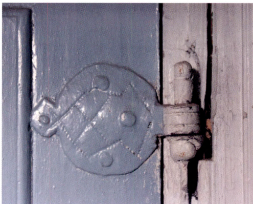
Fig. 9. Järnbeslag på förstugans innerdörrar.