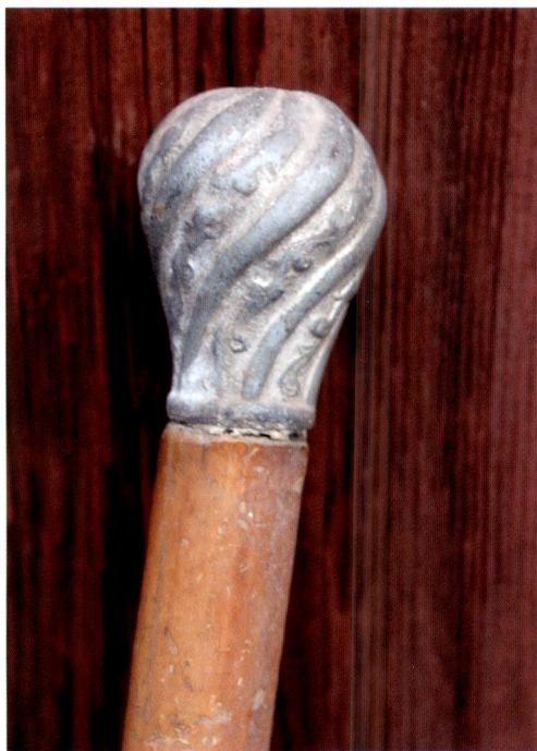
Fig. 7. I samband med 2017 års renovering framkom en undangömd käpp, ett så kallat spanskrör, inne i byggnaden. Käppens övre, metallbeslagna del.

gårdstomtens östra hälft vilka är försvunna på 1833 års karta. Istället finns då ett antal byggnader direkt söder om gårdstomten.