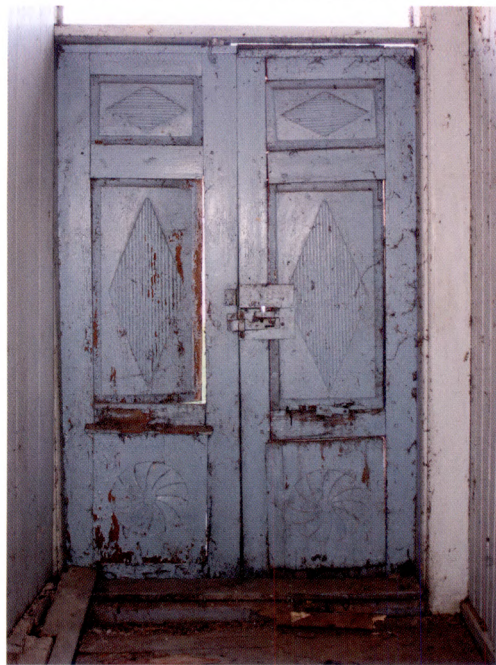
Fig. 8. Insidan av pardörr på husets östra långsida. Troligen har denna sida ursprungligen varit vänd utåt.

Från förstugan leder tre olika dörrar in till kammare, dagligstuga samt anderstuga. En så kallad halvfransk dörr, med två jämn-