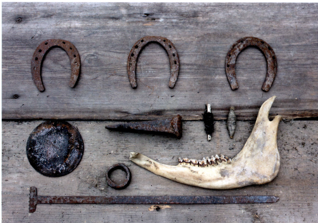
Fig. 12. Föremål som husets nuvarande ägare hittade ovanpå bakugnen år 2017.

ena sidan, en sammanväld järnring samt ena halvan av en vävspännare. Därtill fanns ett nystan av svart ulltråd och annat av vitt lingarn. I föremålssamlingen ingick också en större underkäke från nötboskap. 17