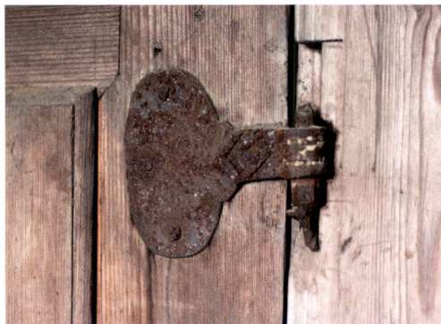
Fig. 10. Järnbeslag på dörr på husets ovanvåning.

stora speglar som stilmässigt hör hemma i 1600- och 1700-talen, leder in till dagligstugan. Mellan förstuga och anderstuga, respektive kammare finns rokokodörrar från 1700-talets mitt eller senare del, med en smal spegel i mitten, en underliggande större sådan samt en ännu större överliggande dito. Flera av dörrarnas gångjärnsbeslag är av äldre typ och skulle kunna vara från 1700-talets förra hälft (fig. 9–10).