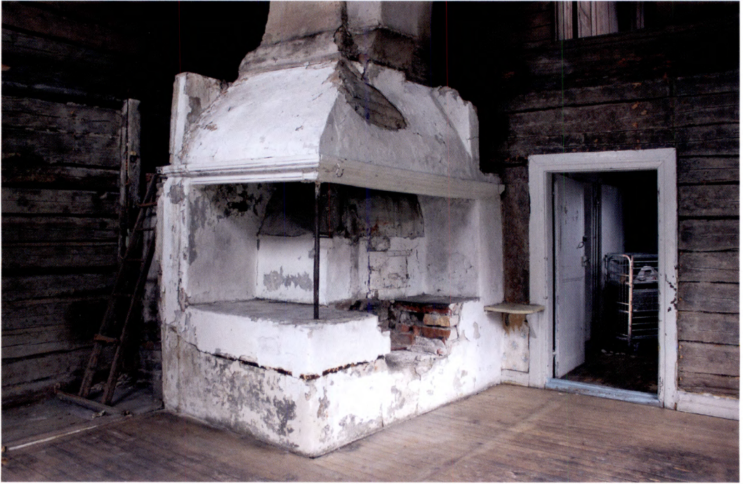
Fig. 2. Dagligstugans eldstad. Stegen till vänster står lutad mot det utrymme där en märklig samling av föremål påträffades ovanpå den utskjutande delen av bakugnen.

av papperstapet utanpå två underliggande lager av lerklining som båda målats i ljusblått och rosa.