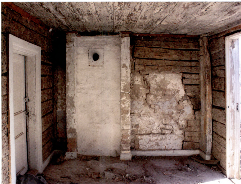
Fig. 3. Kammaren.

är litet och har fyra små blyspröjsade glas i vardera bågen. Troligen har det tidigare suttit i stugans nedervåning. Detsamma gäller den så kallade kronstången med dekorerade stånghållare av trä som hänger från taket i det södra rummet på ovanvåningen (fig. 4). Sådana användes för upphängning av livsmedel samt kläder som behövde torkas m.m. Invid trappan finns en mindre kupa med fönster. Ett igensatt hål i timret, strax under detta fönster, visar att denna kupa är sekundär och att det där tidigare har suttit ett mindre fönster av samma storlek som det i ovanvåningens lilla kammare.