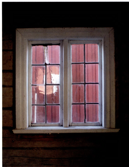
Fig. 11. Blyspröjsat fönster i anderstugan.

Flera av husets fönster består av tvådelade bågar med mittpost där varje båge är försedd med tre glas med mellanliggande spröjs. Dessa fönster skulle kunna vara från 1800-talets förra hälft. Dock finns även några fönster med mera ålderdomliga drag. På ovanvåningen sitter ett mindre, blyspröjsat fönster ovanför kammaren, mitt på husets