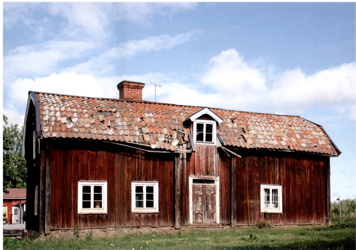
Fig. 1. Den äldre mangårdsbyggnaden i Skuttungeby.